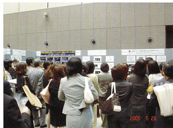
写真2 ポスター会場風景