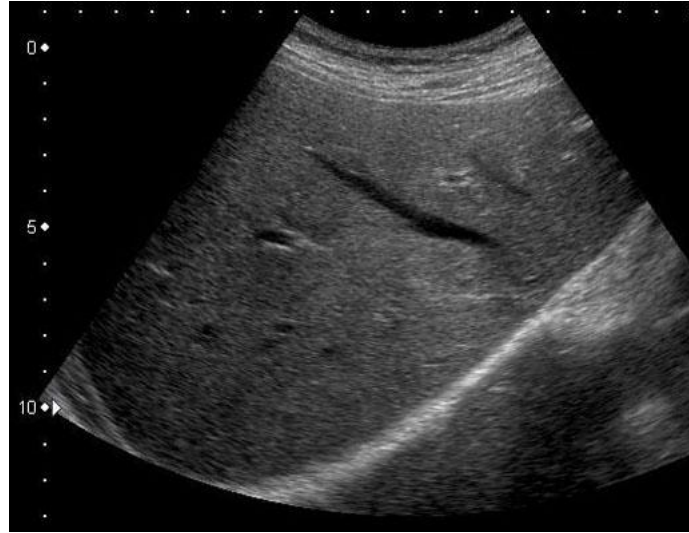
(走査法：右季肋下斜走査) ※走査方法は必ず記載すること

※写真裏面に、受験者氏名・受験領域・抄録番号を付記し、はがれないように貼付すること。あるいは、電子画像をコピー&ペーストで貼り付けてもよい。