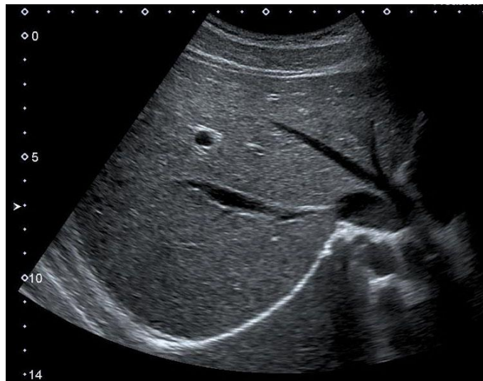
(走査法: 右季肋下斜走査) ※走査方法は必ず記載すること

[写真貼付欄] 写真の個人情報 (氏名、ID、生年月日) は必ず削除するか、読み取れないように消去すること。 ※写真裏面に、受験者氏名・受験領域・抄録番号を付記し、はがれないように貼付すること。あるいは、電子画像をコピー&ペーストで貼り付けてもよい。